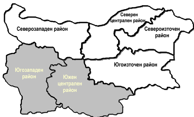
Фиг.1. Регионално деление на ниво NUTS 2 в България

Регионалното деление в България в обобщен вид е представено на фигура 1.