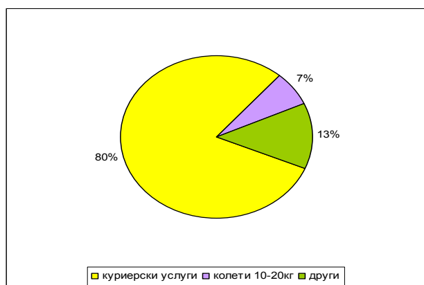
Фиг.2 Съотношение между куриерски услуги и колетни пратки за 2006 г [1].

В страната са регистрирани по закона за пощенските услуги като неуниверсален пощенски оператор и притежават лиценз за превозвач на товари по Закона за превоз на пътници и товари фирми като: "Спиди", "Сити Експрес", "Еконт Експрес", "Експресо", "Европът 2000 АД", "Български пощи АД" "Интерлогистика" и др. Чрез свои представителства в националната мрежа предлагат услуги и световни гиганти в тази област – DHL, FEDEX, UPS и TNT. По данни на Комисията за регулиране на съобщенията 80% от всички неуниверсални пощенски услуги са куриерските услуги (фиг.2). В куриерска фирма „Спиди” например месечно се обработват приблизително над 500 00 пратки от 0,5 до 6000 kg.